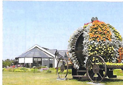
「道と川の駅 花ロードえにわ」

市民会館大会議室では、9月16日(日)15時~19時まで、全国交流サロンがオープンします。研究フォーラム・種目別大会の合間にぜひお立ち寄りください。お待ちしております。