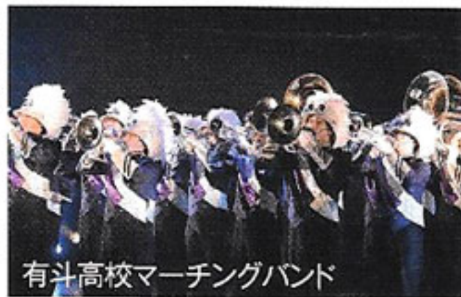
有斗高校マーチングバンド

フォーラムに参加の方は、終了がお昼となりますので、会場の函館大学から市民会館に移動していただき、お土産を購入されたり食事をしたりしながら閉会式に参加をいただけるよう、よろしく願いいたします。