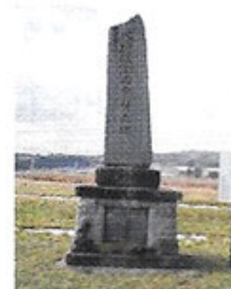
北斗市水田発祥の地